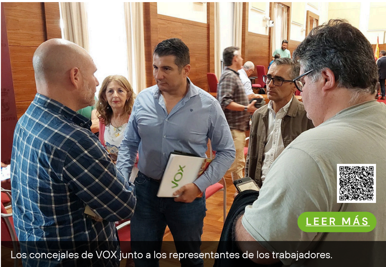
Los concejales de VOX junto a los representantes de los trabajadores.

VOX Chiclana ha defendido, en un Pleno extraordinario, la necesidad de velar por garantizar el trabajo de los casi 100 empleados de la concesionaria AOSSA , encargada de los servicios deportivos municipales, tras “la nefasta gestión que está haciendo el Gobierno local de este asunto”. Tras llevar por urgencia el pliego de condiciones que ha de regir el contrato hace varios plenos, “se ha propiciado un conflicto laboral, con huelga incluida, que ha afectado a las actividades deportivas y que está generando problemas a la plantilla, todo como consecuencia de una mala gestión del Gobierno municipal de PSOE e IU”.